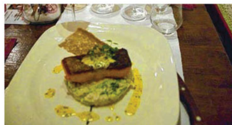
La cuisine suisse, loin des clichés. Une vraie découverte. ■ VL

Pour beaucoup, la cuisine suisse se résume à la fondue, voire à la raclette et au fendant. Se contenter de cette image, c'est passer à côté de vraies merveilles. Nul besoin d'arpenner les rives du Léman et ses palaces pour se faire plaisir gustativement : l'hôtel du Besso, à Zinal, vous fera voyager dans le Valais, au travers de votre assiette et de votre verre. Construit en 1893 pour accueillir les randonneurs alpins, cet hôtel offre en plus une vue