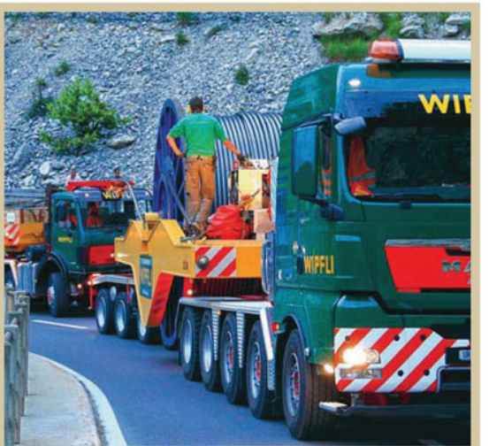
1. Les nouvelles cabines sont en place et n'attendent plus que le feu vert. 2. Un convoi de 170 t sur les routes étroites du Val d'Annivières, pour acheminer les câbles porteurs. 3. La « réserve » de câbles 4. Les skieurs arriveront depuis Grimentz, directement au sommet de Sorebois. 5. Vincent Epiney, ingénieur de l'installation 6. 1.100m avant le 1 er pylône...